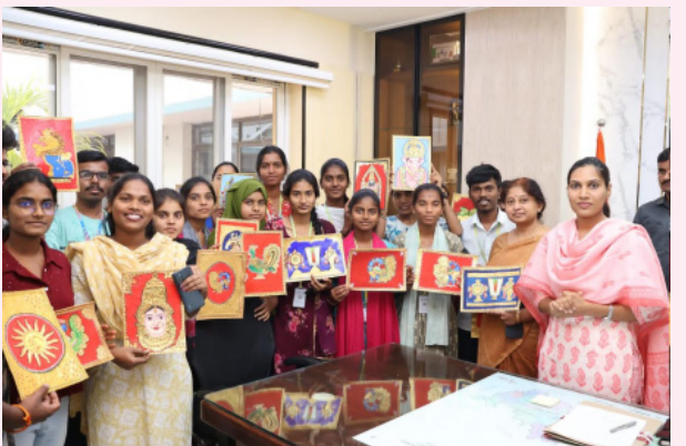
సంగారెడ్డి, భారత శక్తి ప్రతినిధి, జనవరి 9 :