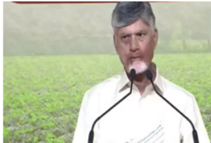
అవుతుంది" అని సీఎం చంద్రబాబు తెలిపారు.

రాష్ట్రం: కరోనా నమయంలోనూ రైతులు పనిచేసి అందరికీ ఆస్తుల పెట్టుబడి ఏవీ నీవం చంద్రబాబు అన్నారు. తూర్పు గోదావరి జిల్లా రాయవరంలో వర్షంవచ్చిన సీఎం చంద్రబాబు.. రైతులకు పట్టణాల పానుపట్టణాల పంపిణీ కార్యక్రమంలో పాల్గొని మాట్లాడారు. రైతుల భూమి వలెనే జాగ్రత్తగా జాగ్రత్తగా ఎందుకు చేశాలో అర్థం కాలేదన్నారు. గత ప్రభుత్వ నేతల ప్రయోజనాలను ఆలోచనలని.. 'మీ భూమి - మీ హక్కు' అని ఎన్నడూ ప్రచారంలోనే తాము చెప్పినట్లు గుర్తు చేశారు. రాజమండ్రి నేని పానీయకలు ఇస్తామని హామీ ఇచ్చామని, దాన్ని ఇప్పుడు నెరవేర్చామని తెలిపారు.